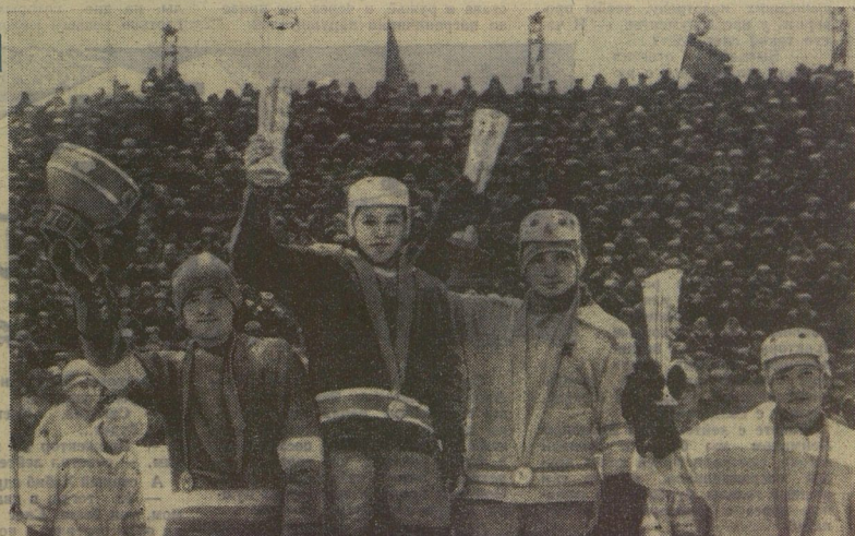
Приятно стоять капитанам на пьедестале почёта.