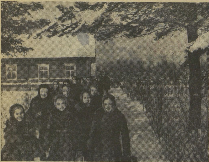
Как и все школьники нашей огромной страны, эти сельские ребята снова отправились в путешествие по стране Знаний.